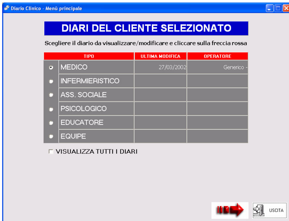
Fig. 12: Pagina della selezione del diario cliente

La stampa viene fatta attraverso Microsoft Word, e quindi è possibile personalizzarla o utilizzarla per creare relazioni ad-hoc prima di stamparla effettivamente.